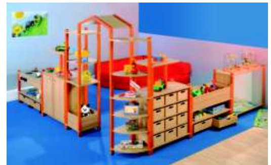
Unsere Abbildung zeigt das Fertigregalsystem „Vanessa“ mit der Stollenfarbe orange

Alle Stollen sind aus massiver Buche gefertigt (40 x 40 mm), mit speichelfestem Lack gefärbt. Korpusfronten und -böden fertigen wir aus pflegeleichten und robusten Melamin beschichteten E1 Feinspanplatten.