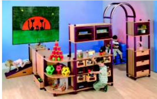
Unsere Abbildung zeigt das Fertigregalsystem „Tobias“ mit der Stollenfarbe bordeaux